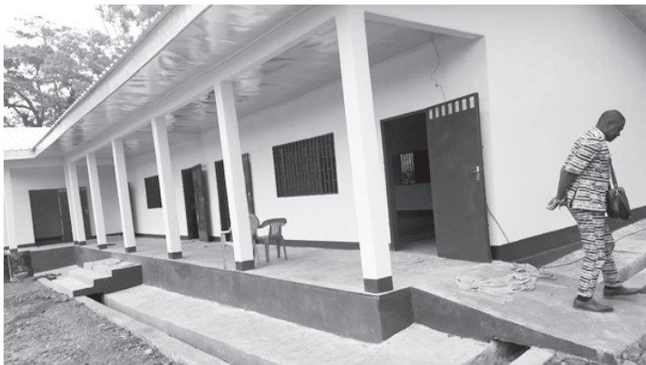
Construction d'un bloc de deux salles de classe avec bureau du directeur au CFPR-MI de Bandenkop, dans la commune de Bangou