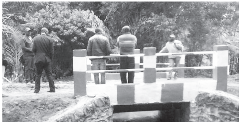
Construction d'un ponceau sur la piste Deukeng par Tsewe